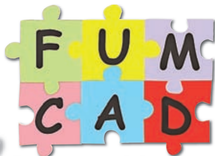
Fundo Municipal dos Direitos da Criança e do Adolescente

As doações aos novos projetos do Fumcad devem ser feitas até o fim deste mês, já que o dinheiro obedece ao princípio da anterioridade de recursos, para serem usados no ano seguinte.